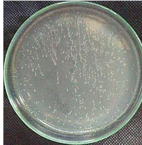
Gambar 4 Koloni Bakteri Staphylococcus aureus yang tumbuh pada media NA

Berdasarkan tabel 1 terlihat bahwa koloni bakteri Escherichia coli dan Staphylococcus aureus yang tumbuh pada media NA menunjukkan jumlah koloni tertinggi. Sedangkan jumlah koloni bakteri Escherichia coli dan Staphylococcus aureus pada media kacang tanah menunjukkan jumlah koloni terendah.