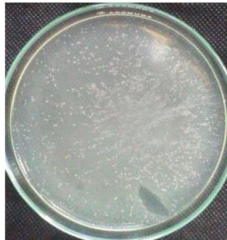
Gambar 2 Koloni Bakteri Escherichia coli yang tumbuh pada media NA