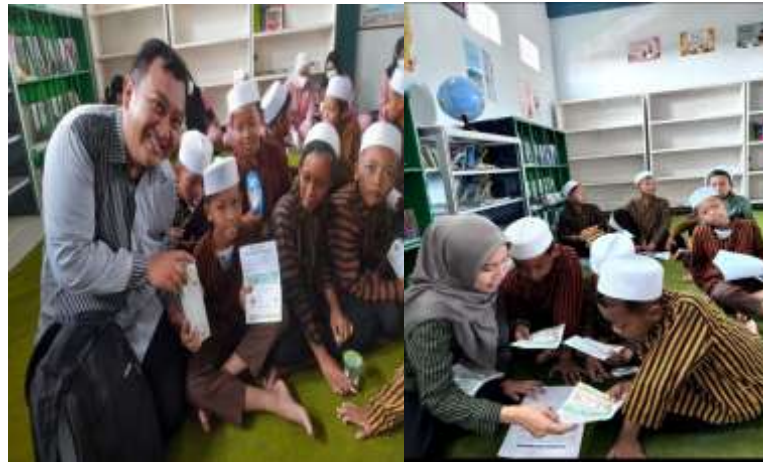
Gambar 2. Kegiatan edukasi Imunomodulator Alami Berbasis Menu Makanan Bergizi Terhadap Daya Tahan Tubuh

Daya tahan tubuh yang optimal merupakan fondasi penting bagi kesehatan anak usia sekolah, khususnya dalam masa pertumbuhan dan aktivitas belajar yang padat. Siswa Sekolah Dasar (SD) termasuk dalam kelompok yang rentan terhadap penularan penyakit infeksi, seperti influenza, ISPA, dan penyakit lainnya (10). Faktor gizi seimbang memegang peranan krusial dalam mendukung sistem imunitas tubuh. Asupan gizi seimbang yang kaya akan zat imunomodulator alami dapat memperbaiki dan mengatur sistem imun dapat menjadi solusi praktis dan berkelanjutan untuk meningkatkan ketahanan tubuh siswa (10). Integrasi pendidikan gizi ke dalam kurikulum formal telah direkomendasikan oleh World Health Organization (WHO) dalam rangka Health Promoting Schools (Sekolah yang Mempromosikan Kesehatan), hal ini menekankan gizi harus menjadi bagian dari kurikulum inti dan terintegrasi dalam mata pelajaran yang relevan misalnya mata pelajaran IPA (materi sistem pencernaan dan zat gizi), PJOK (materi pola hidup sehat), bahkan melalui praktik langsung dalam seni budaya (memasak), sehingga tidak hanya sebagai kegiatan tambahan serta menyerukan keterampilan hidup berbasis kesehatan (seperti memilih makanan bergizi) untuk semua siswa (11)(12)(13)(14)(15)(16).