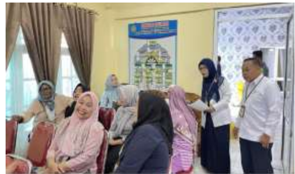
Gambar 1 dan 2. Penyuluhan tentang penyakit Jantung Koroner dan Hipertensi