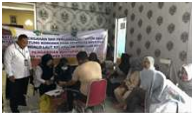
Gambar 3. Pemeriksaan Kesehatan